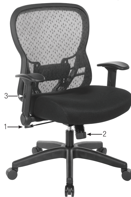
529R-R2N1F2 & 529R-R22N1F2 (pas montré)

ATTENTION: MAKE SURE ALL SCREWS ARE FULLY TIGHTENED BEFORE USING CHAIR.